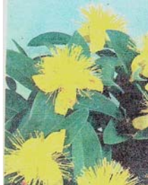
Grandes fleurs jaunes de Hypericum calycinum

Hypericum olympicum est une espèce de plus petite taille (15 à 20 cm) au feuillage vert gris. Les fleurs sont réunies par 3 à 5 en bouquets terminaux. La variété citrinum est très souvent préférée, car elle offre des fleurs de couleur jaune pâle.