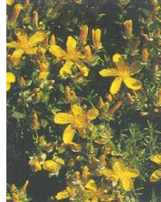
Hypericum olympicum avec ses fleurs en bouquets terminaux