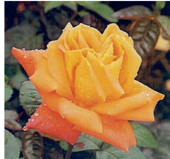
"De Funès" hybride de Thé