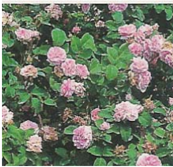
Rosa centifolia "Petite Hollande" d'origine inconnue

Ce sont des rosiers rustiques dont le feuillage est souvent vert argenté. On peut les palisser pour obtenir un bel effet.