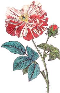
Rosa gallica serait la première rose cultivée.

Ce sont des rosiers présentant la forme d'un buisson, produisant des fleurs parfumées aux pétales allant du rose foncé au pourpre.