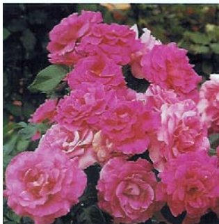
"Manou Meiland" rosier Floribunda

(Les rosiers polyanthas ramassés ou étalés, de petite taille constituent de jolies bordures fleuries.)