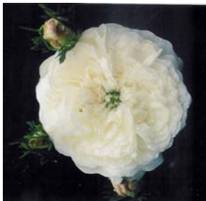
"Mme Hardy, rosier de Damas

Les roses sont également appelées rose chou compte tenu de leurs pétales serrés, recourbés et un peu froissés. La plupart de ces rosiers font de longs fruits un peu poilus.