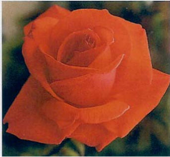
"Super Star" hybride de Thé

Le premier hybride de Thé fut "La France", obtenue par le pépiniériste français Guillot, en 1867.