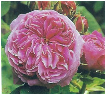
Rosier de Portland "Yolande d'Aragon", obtenteur Vibert (1843)

Ce sont des rosiers remontants (une deuxième floraison au cours de l'année) qui portent des fleurs roses, parfumées, semi-doubles à doubles.