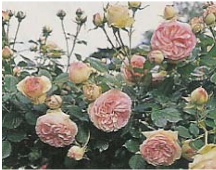
"Pierre de Ronsard" rosier moderne, obtenteur Meilland (1986), croisement "Kalinka" x "Haendel" et "Danse des Sylphes"

C'est une activité florale reconnue et les variétés nouvelles ne peuvent être multipliées qu'avec l'accord des obtenteurs (Delbard, Meilland, Laperrière, etc.).