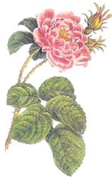
Rosa centifolia est apparue en Hollande au 19 e siècle.