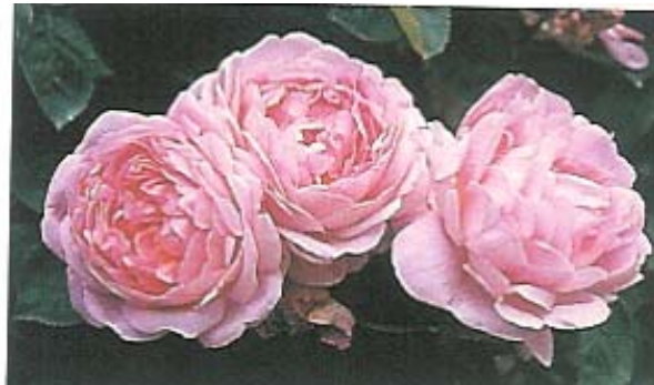
"Constance Spry" rosier moderne, obtenteur Austin (1961), croisement "Belle Isis" x "Dainty Maid"